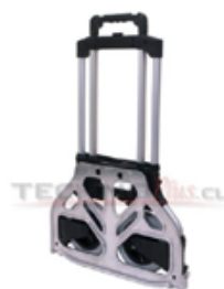
BOTON MANGO RETRACTIL